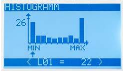
Vertegenwoordiging van de frequentieverdeling in de precisie krachtmeter PCE-FB-serie