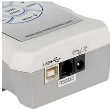
Precisie krachtmeter voor kracht en drukkracht