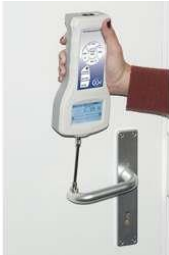
Precisie krachtmeter PCE-FB serie met interne cel voor trek- en drukkracht meting