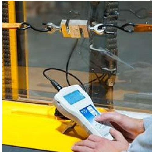
PCE-FB K precisie krachtmeter met externe cel voor spanning en drukkracht