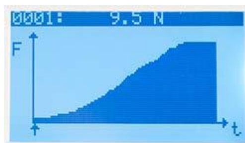
Precisie-krachtmeter: Uitlezing of opslag in diagramvorm waarbij individuele meetpunten opgevraagd kunnen worden.