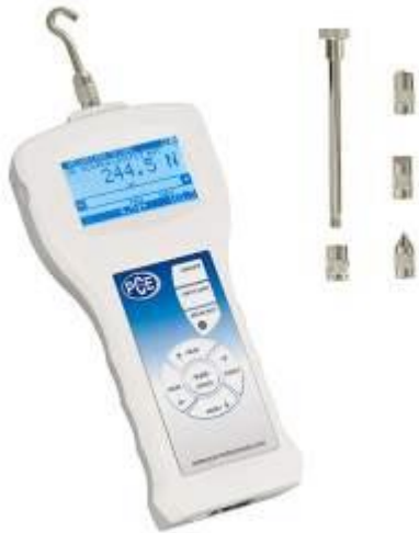
Precisie power meter met interne meetcel van de PCE-FB-serie