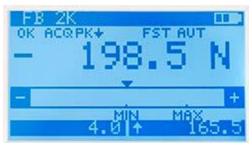
Precisie krachtmeter: Informatie over de batterijstatus, meetsnelheid, kracht, max en min waarden in één oogopslag.