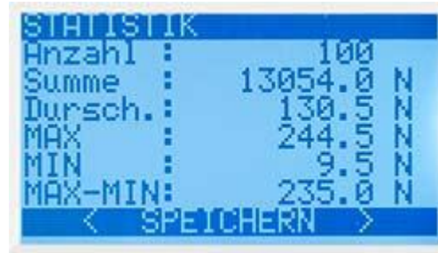
8 voorinstellingen met individuele kenmerken en elk 800 metingen in precisie krachtmeter