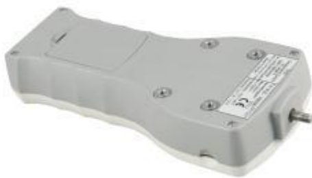
Achterkant van de precisie power meter met interne cel. U kunt het batterijcompartiment en de vier-punts meting zien.