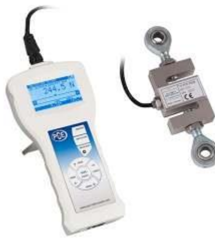
Precisie krachtmeter met externe meetcel van de PCE-FB K-serie